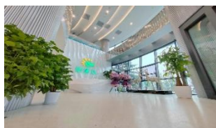
宽敞明亮公司大厅