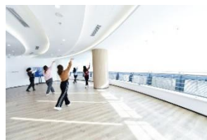
多姿多彩社团生活